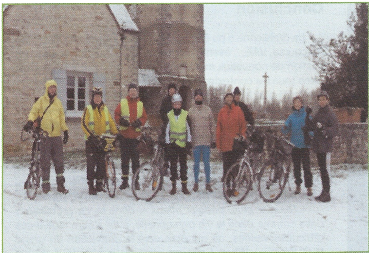
Figure 5 - Cette photo nous apporte la preuve concrète que grâce aux sciences et aux technologies, sont disponibles actuellement des vélos et des équipements permettant à des non-professionnels, y compris d'âge mûr, de parcourir en sécurité des dizaines de kilomètres par tous les temps ! Ce jour-là, nous sommes allés de Sens à Moret-sur-Loing dans de la neige « agrémentée » par moment de verglas... (photo : Club MDB, DR).