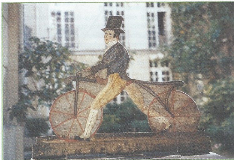
Figure 1 - La draisienne, brevetée en 1818 sous le nom de vélocipède, considérée comme l'ancêtre du vélo.

La pratique du vélo nous apporte des bienfaits en tous genres [2-4], mais la plupart des cyclistes eux-mêmes ne sont pas assez conscients des travaux considérables qui ont été réalisés en science et technologie des matériaux, et donc le rôle majeur de la chimie, pour arriver à ce résultat.