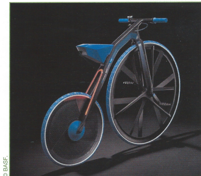
Figure 7 - Le « Concept 1865 » de BASF.