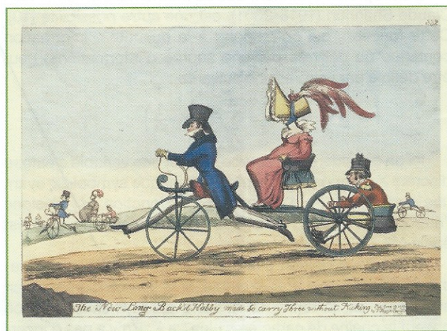
Figure 2 - Année 1819 : un grand progrès par rapport à la chaise à porteur qui impliquait un travail harassant pour deux porteurs ! (Collection particulière Jacques Seray).

L'échoppe du fabricant de draisienne est devenue une véritable usine munie de grandes hottes ( figure 3 ). Le fer forgé est ensuite envoyé dans l'atelier de peinture. Il s'agit de peinture appliquée au pinceau, sans doute du type huile de lin, essence de térébenthine, pigment minéral.