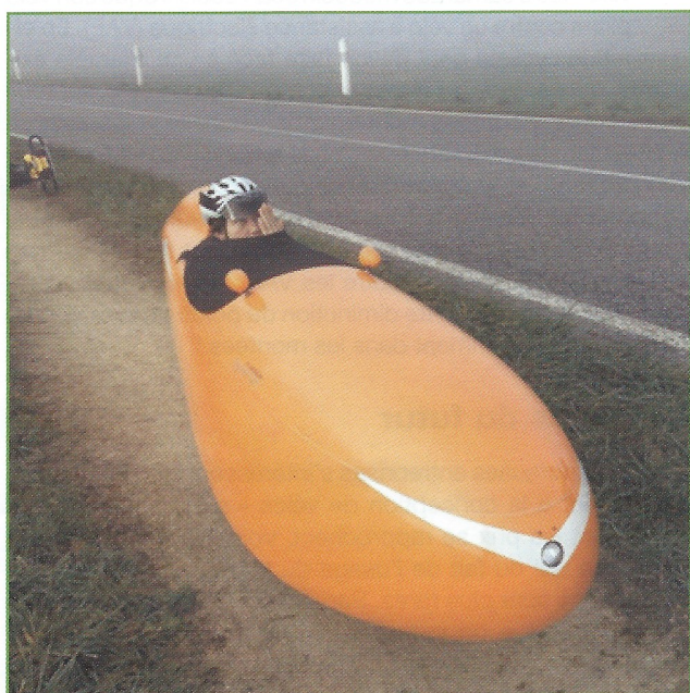
Figure 8 - Ceci est un... vélo avec carrosserie en fibres de carbone et polymères, croisé fin 2014 (photo ; P. Pichat, DR).

matériaux » : sa draisienne du XXI e siècle a été fabriquée fin 2013 à partir de plus de 20 de ses différents plastiques (figure 7) [11].