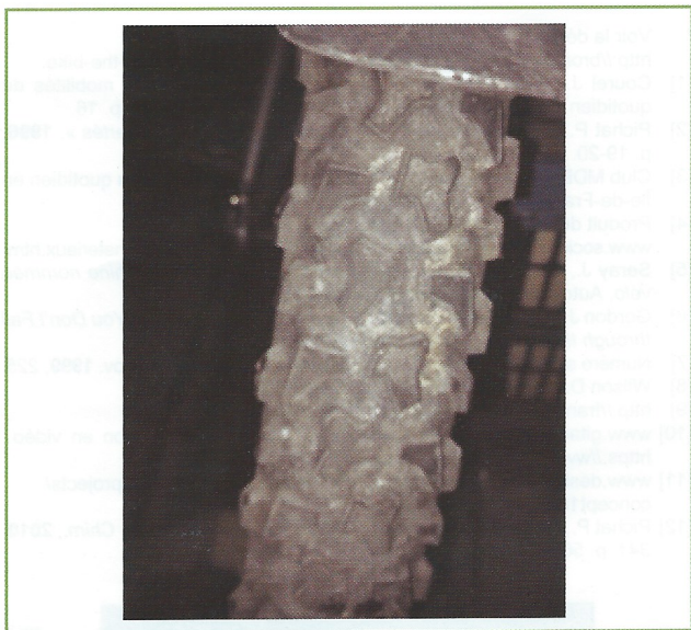
Figure 6 - Pneu adapté même à 35 cm de neige fraîche. Expérience et photo : P. Pichat.