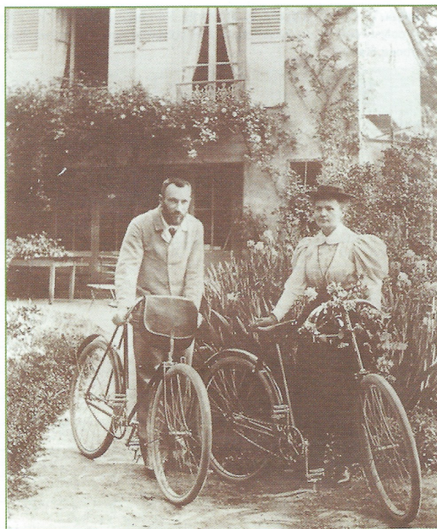
Figure 4 - Pierre et Marie Curie, Sceaux, 1895.

chaîne qui transmet l'énergie mécanique à la roue arrière. De nouveaux types de selles bien différents de celle de la draisienne, certes toujours en cuir, furent alors inventés.